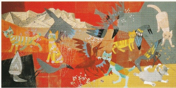
《楽しい仲間》昭和31(1956)年 株式会社米ハグループ蔵