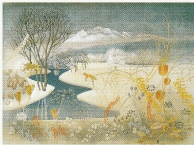
《冬野の詩》昭和63(1988)年 株式会社米ハグループ蔵