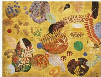
《華やく終焉》平成16(2004)年 並崎大村美術館蔵