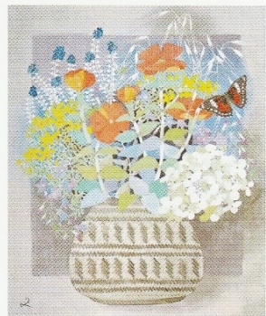
《蝶と草花》昭和55(1980)年頃 名都美術館蔵

本展では、“群れない”“慣れない”“頼らない”を信条に100年の人生を歩んだ画家の創作の軌跡を、初期作品から最後の作品となった《紅梅》まで、100余点でたどり、多くの人を魅了し続けた人間像にも迫ります。