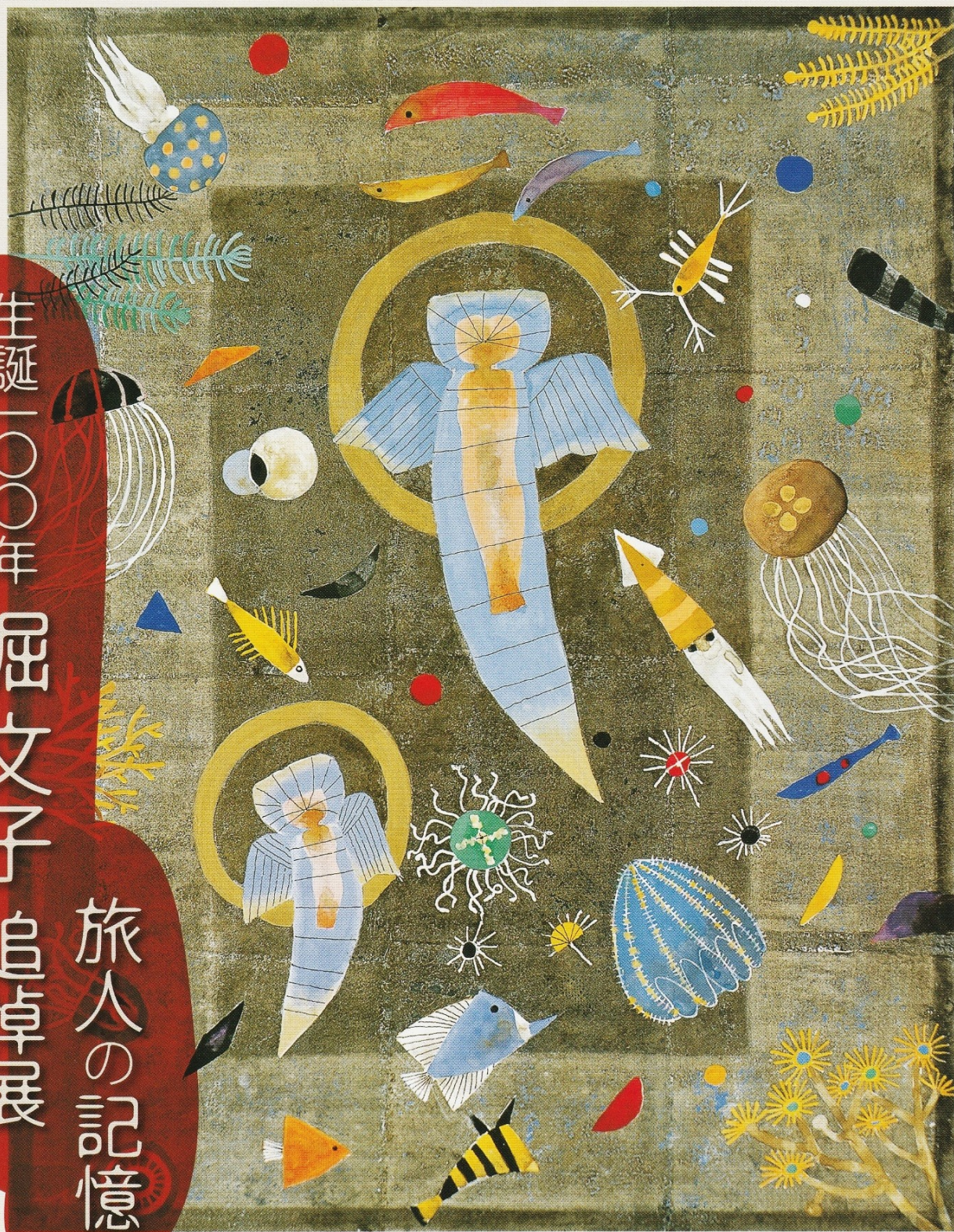
堀文子《妖箱(クリオネ)と遊ぶ》平成15年(2003)年 株式会社米ハグループ蔵