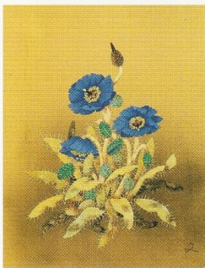
《幻の花 ブルーポピー》平成13(2001)年 株式会社米ハグループ蔵